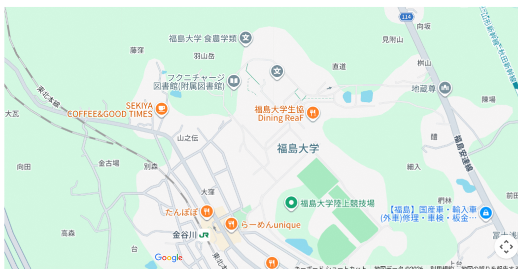
福島大学（〒960-1296 福島県福島市金谷川1）

会場：福島大学（各種委員会）、コラッセふくしま（メイン会場・公開シンポジウム・企業展示）